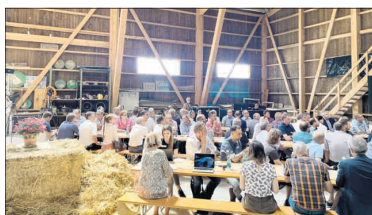
Die Auftaktveranstaltung findet auf dem Hof Krieshütten oberhalb von Luthern statt.

Die 22 Gemeinden aus der Region Luzern West gründeten im vergangenen Oktober eine einfache Gesellschaft und machten sich damit auf den Weg zu einer eigenen, unabhängigen Lösung des Internetproblems. Aus dem EA-Gebiet mit