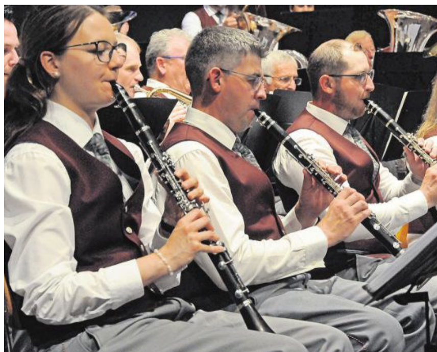
Nicht nur das Holzregister der Musikgesellschaft Rohrmatt erfreute die Herzen des Publikums – ebenso das ganze Korps.